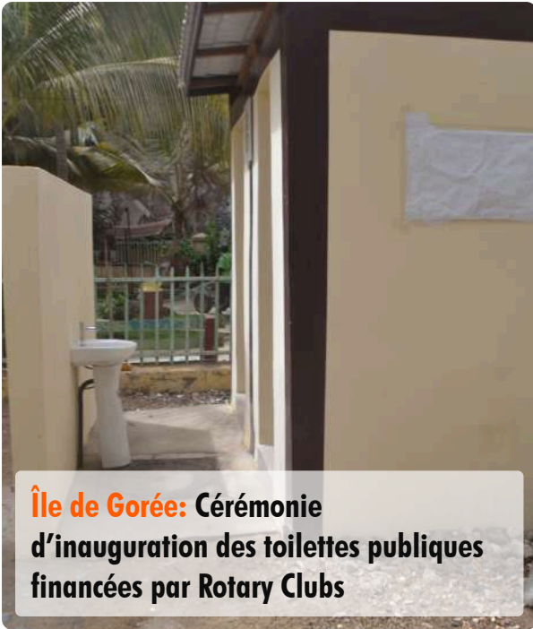
Île de Gorée: Cérémonie d'inauguration des toilettes publiques financées par Rotary Clubs