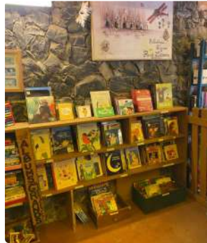
Promouvoir la Littérature Jeunesse au Sénégal : Une Mission de Livre en Liberté in Africa