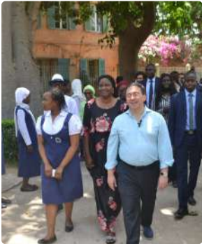
Baccalauréat 2024, le Lycée d'Excellence Mariama BA fait du 100% dès le premier tour