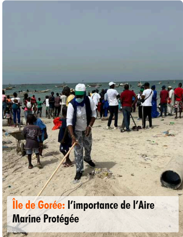
Île de Gorée: l'importance de l'Aire Marine Protégée