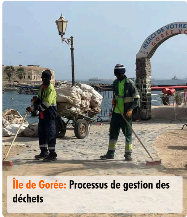
Île de Gorée: Processus de gestion des déchets